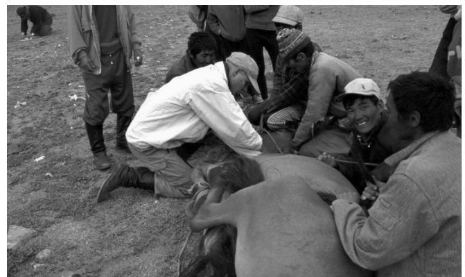
Proyecto WAZA 03002: obtención de muestras de sangre de caballos de Przewalski's ( Equus przewalskii ) reintroducidos en Gobi B, Mongolia.

Esta última área puede tener un doble beneficio: ayudar a ampliar el acuerdo sobre las prioridades de investigación a nivel institucional, regional y/o global y ayudar a entrenar a los futuros biólogos de la vida salvaje.